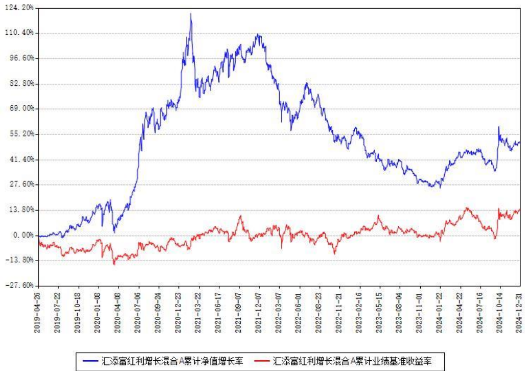
汇添富红利增长混合A累计净值增长率与同期业绩基准收益率对比图