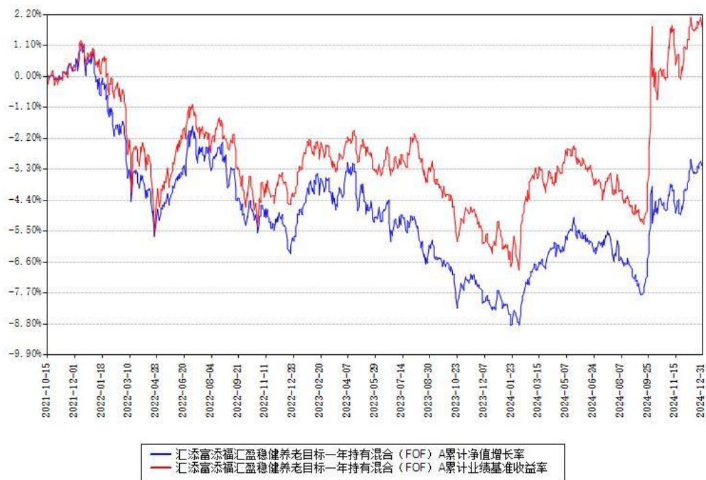
汇添富添福汇盈稳健养老目标一年持有混合（FOF）A累计净值增长率与同期业绩基准收益率对比图