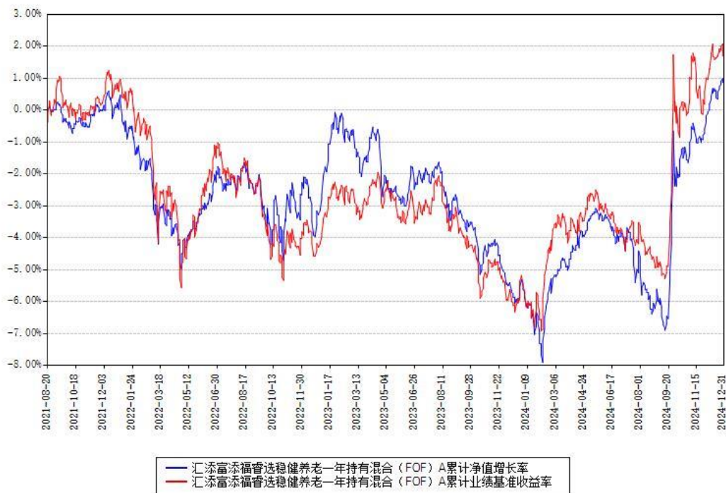
汇添富添福睿选稳健养老一年持有混合（FOF）Y 累计净值增长率与同期业绩比较基准收益率对比图