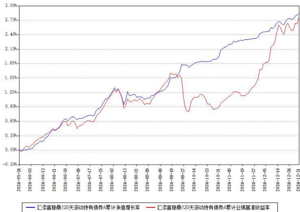
汇添富稳鼎120天滚动持有债券A累计净值增长率与同期业绩基准收益率对比图