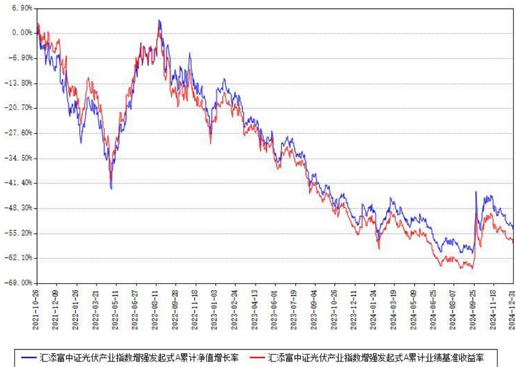
汇添富中证光伏产业指数增强发起式A累计净值增长率与同期业绩比较基准收益率对比图