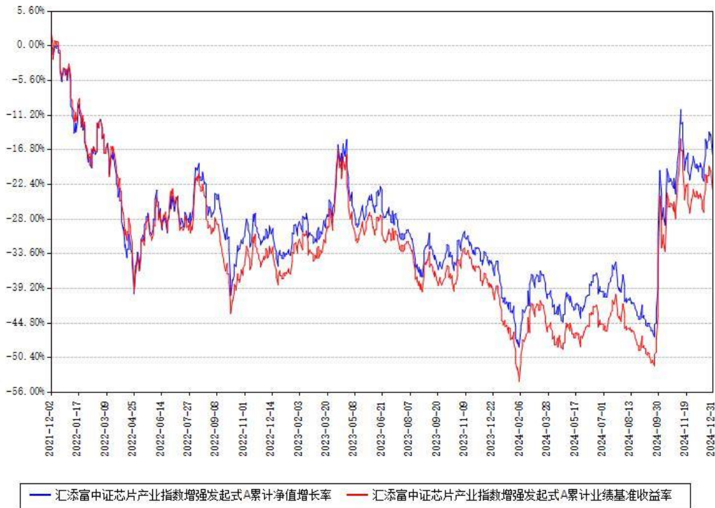
汇添富中证芯片产业指数增强发起式A累计净值增长率与同期业绩比较基准收益率对比图