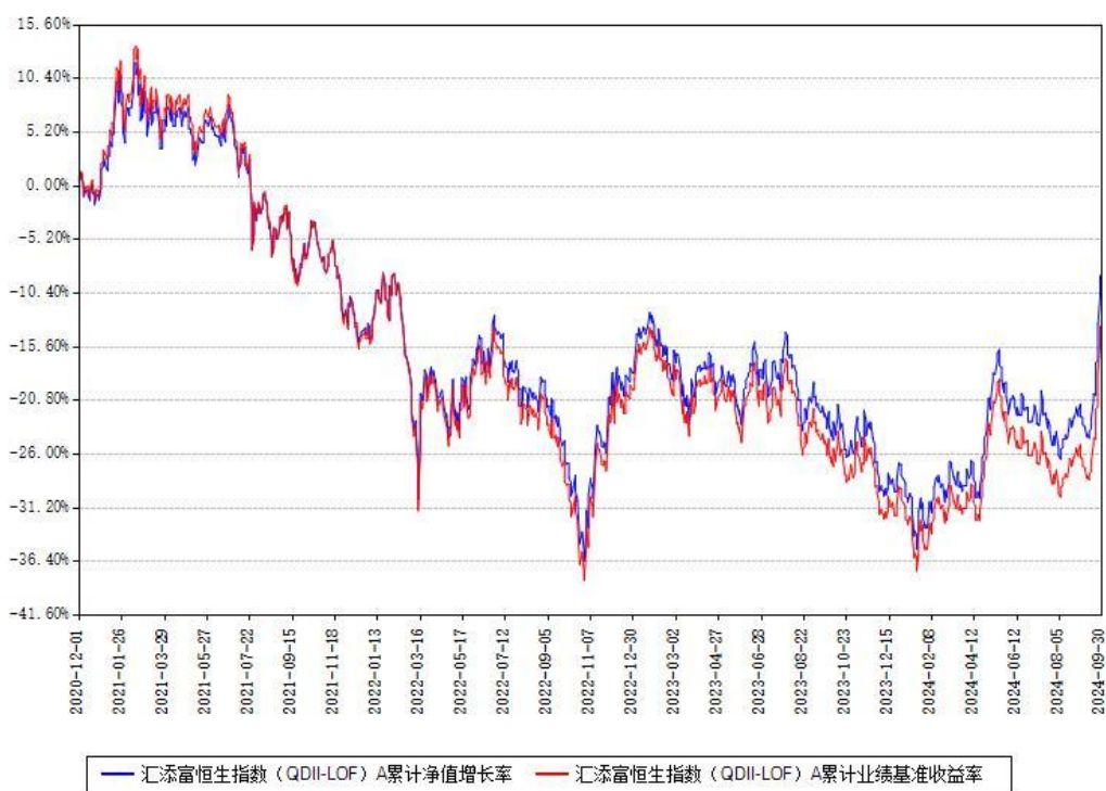
汇添富恒生指数（QDII-LOF）A累计净值增长率与同期业绩基准收益率对比图