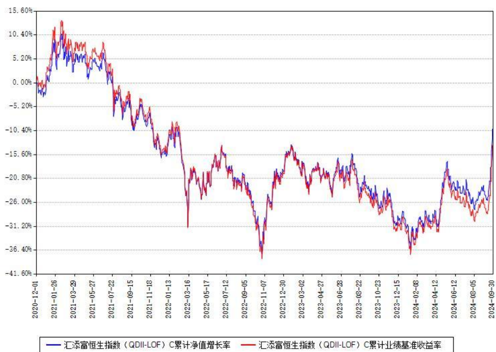
汇添富恒生指数 (QDII-LOF) C 累计净值增长率与同期业绩基准收益率对比图