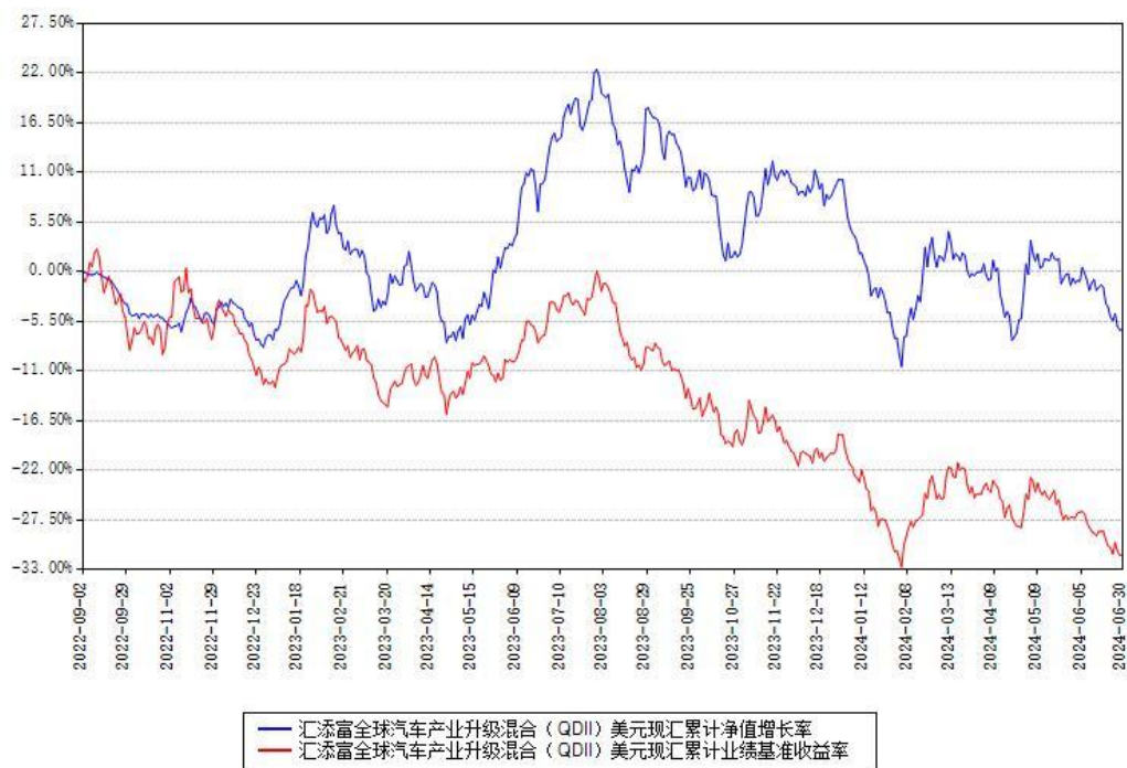
汇添富全球汽车产业升级混合（QDII）美元现钞累计净值增长率与同期业绩基准收益率对比图