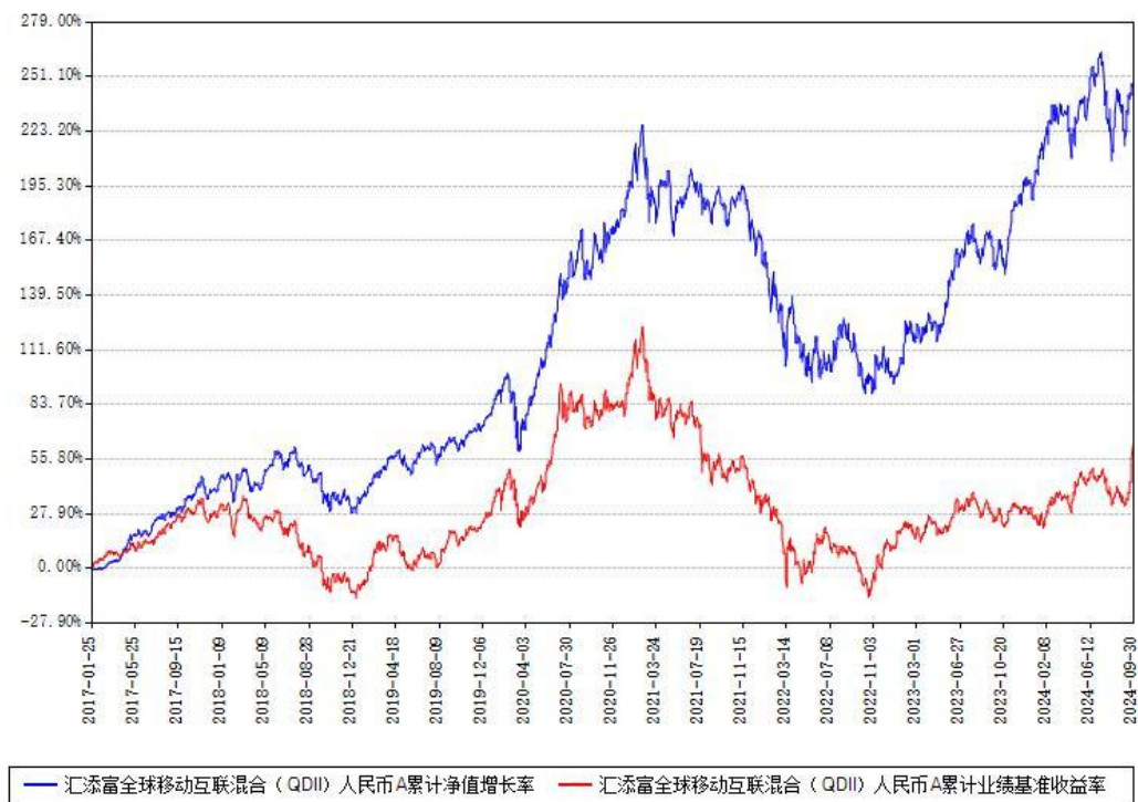
汇添富全球移动互联混合（QDII）人民币C累计净值增长率与同期业绩基准收益率对比图