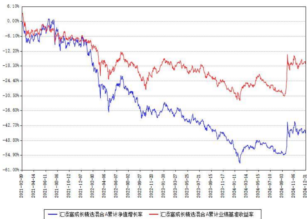
汇添富成长精选混合A累计净值增长率与同期业绩基准收益率对比图

(二)自基金合同生效以来基金累计净值增长率变动及其与同期业绩比较基准收益率变动的比较