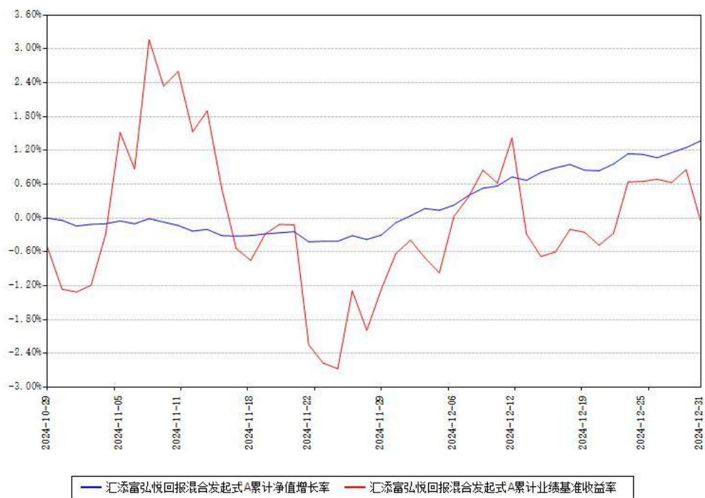
汇添富弘悦回报混合发起式A累计净值增长率与同期业绩基准收益率对比图