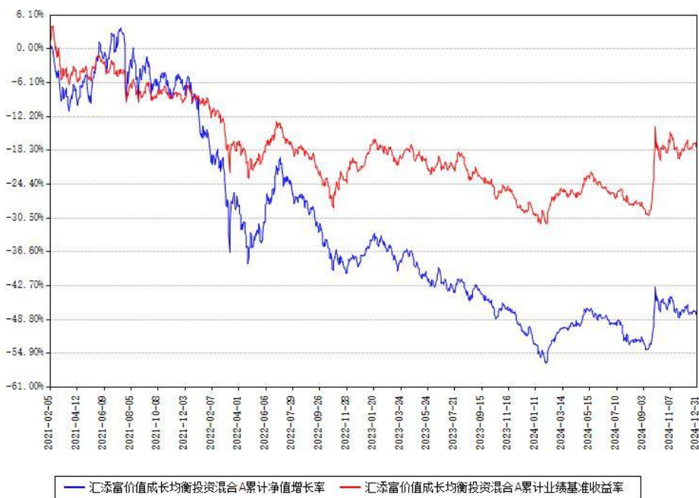
汇添富价值成长均衡投资混合A累计净值增长率与同期业绩基准收益率对比图