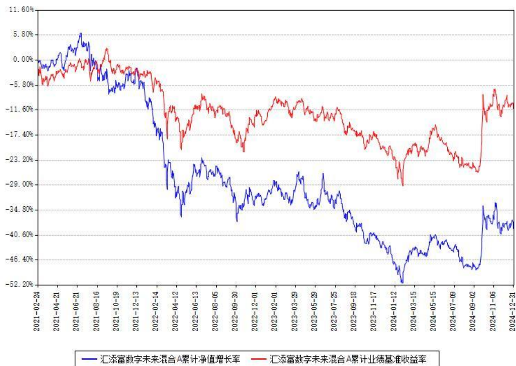
汇添富数字未来混合A累计净值增长率与同期业绩基准收益率对比图