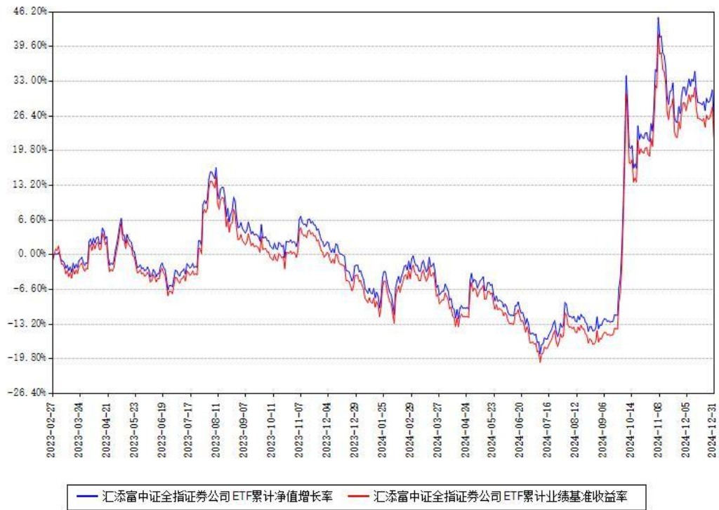
汇添富中证全指证券公司ETF累计净值增长率与同期业绩基准收益率对比图