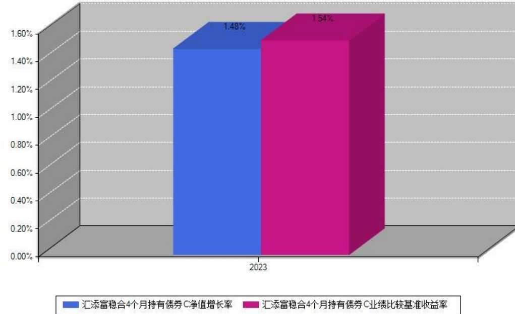
汇添富稳合4个月持有债券C每年净值增长率与同期业绩基准收益率对比图

注：数据截止日期为2023年12月31日，基金的过往业绩不代表未来表现。本《基金合同》生效之日为2023年04月25日，合同生效当年按实际存续期计算，不按整个自然年度进行折算。