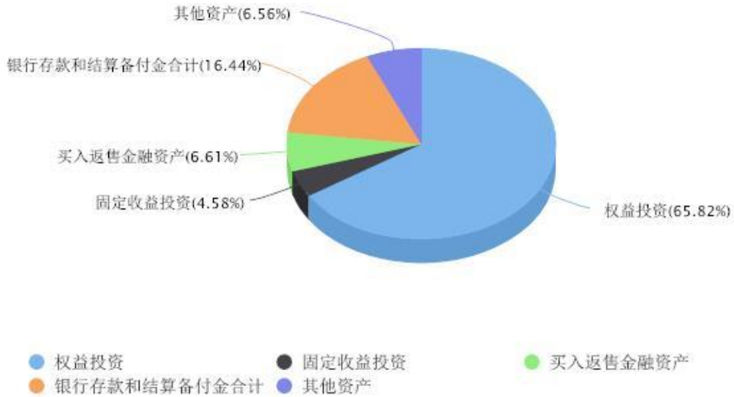
投资组合资产配置图表 数据截止日期:2024年12月31日