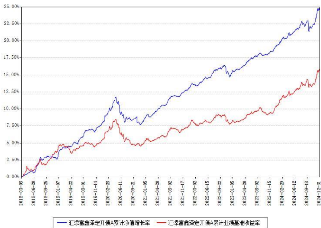
汇添富鑫泽定开债A累计净值增长率与同期业绩基准收益率对比图