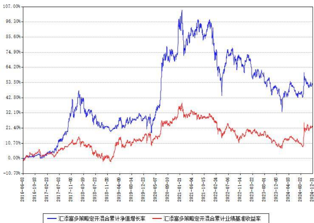
汇添富多策略定开混合累计净值增长率与同期业绩基准收益率对比图

注：本基金建仓期为本《基金合同》生效之日（2016年06月03日）起6个月，建仓期结束时各项资产配置比例符合合同约定。