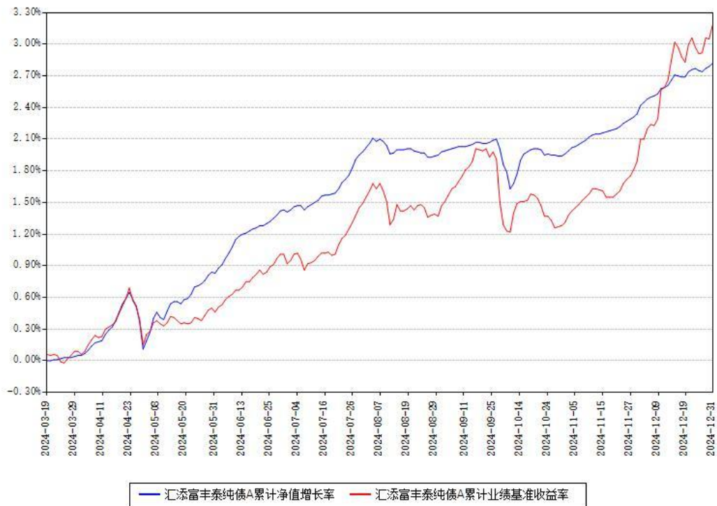
汇添富丰泰纯债A累计净值增长率与同期业绩比较基准收益率对比图