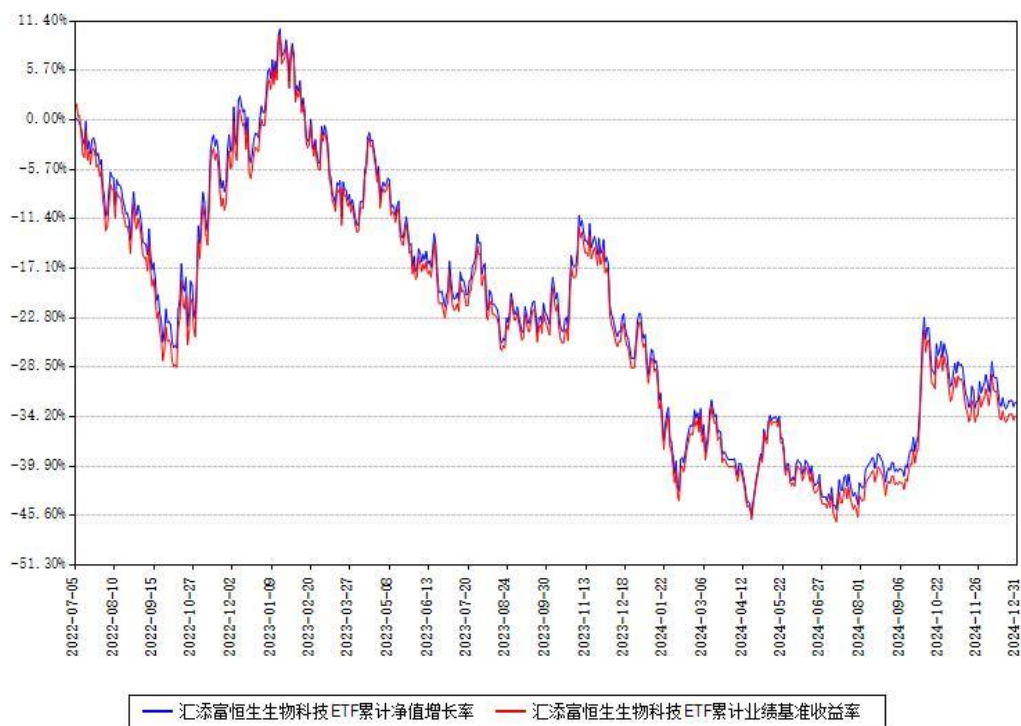
汇添富恒生生物科技ETF累计净值增长率与同期业绩基准收益率对比图

注：本基金建仓期为本《基金合同》生效之日（2022年07月05日）起6个月，建仓期结