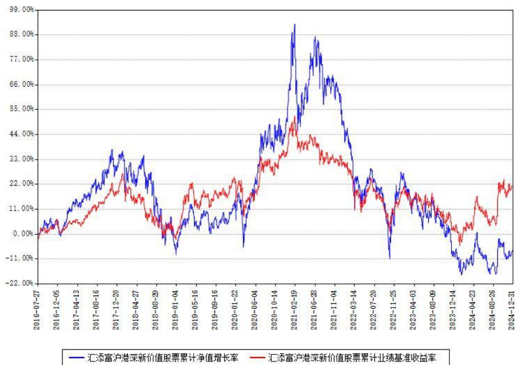
汇添富沪港深新价值股票累计净值增长率与同期业绩基准收益率对比图

注：本基金建仓期为本《基金合同》生效之日（2016年07月27日）起6个月，建仓期结束时各项资产配置比例符合合同约定。