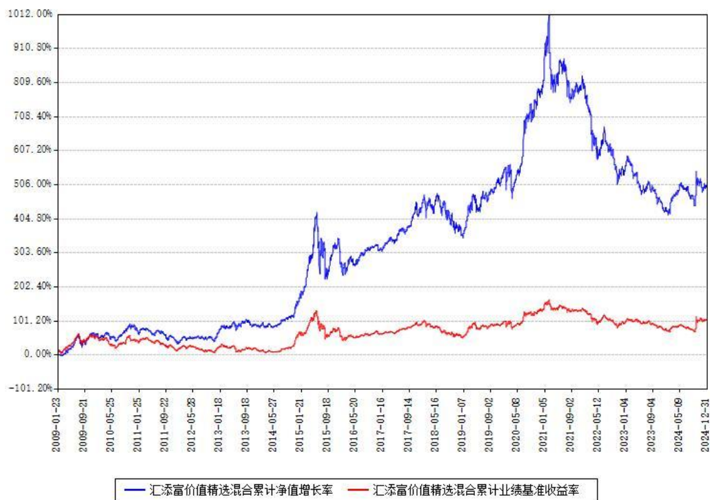
汇添富价值精选混合累计净值增长率与同期业绩比较基准收益率对比图

注：本基金建仓期为本《基金合同》生效之日（2009年01月23日）起6个月，建仓期结束时各项资产配置比例符合合同约定。