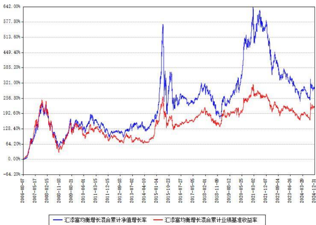
汇添富均衡增长混合累计净值增长率与同期业绩基准收益率对比图

注：本基金建仓期为本《基金合同》生效之日（2006年08月07日）起6个月，建仓期结束时各项资产配置比例符合合同约定。