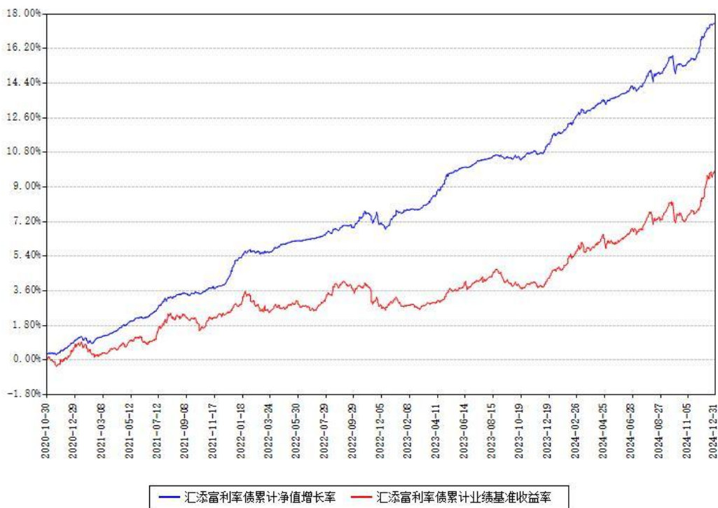
汇添富利率债累计净值增长率与同期业绩基准收益率对比图

注：本基金建仓期为本《基金合同》生效之日（2020年10月30日）起6个月，建仓期结束时各项资产配置比例符合合同约定。