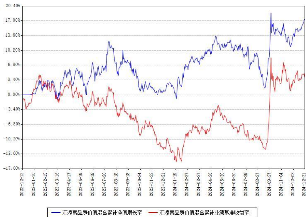
汇添富品质价值混合累计净值增长率与同期业绩基准收益率对比图

注：本基金建仓期为本《基金合同》生效之日（2022年12月12日）起6个月，建仓期结束时各项资产配置比例符合合同约定。