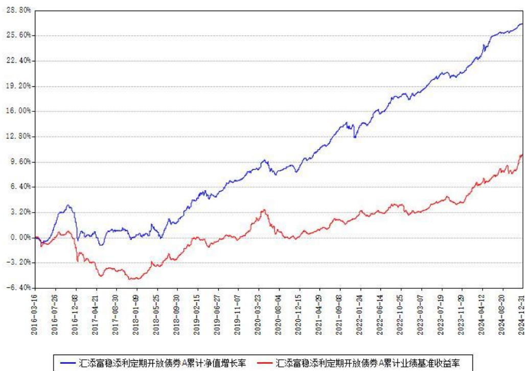
汇添富稳添利定期开放债券A累计净值增长率与同期业绩比较基准收益率对比图