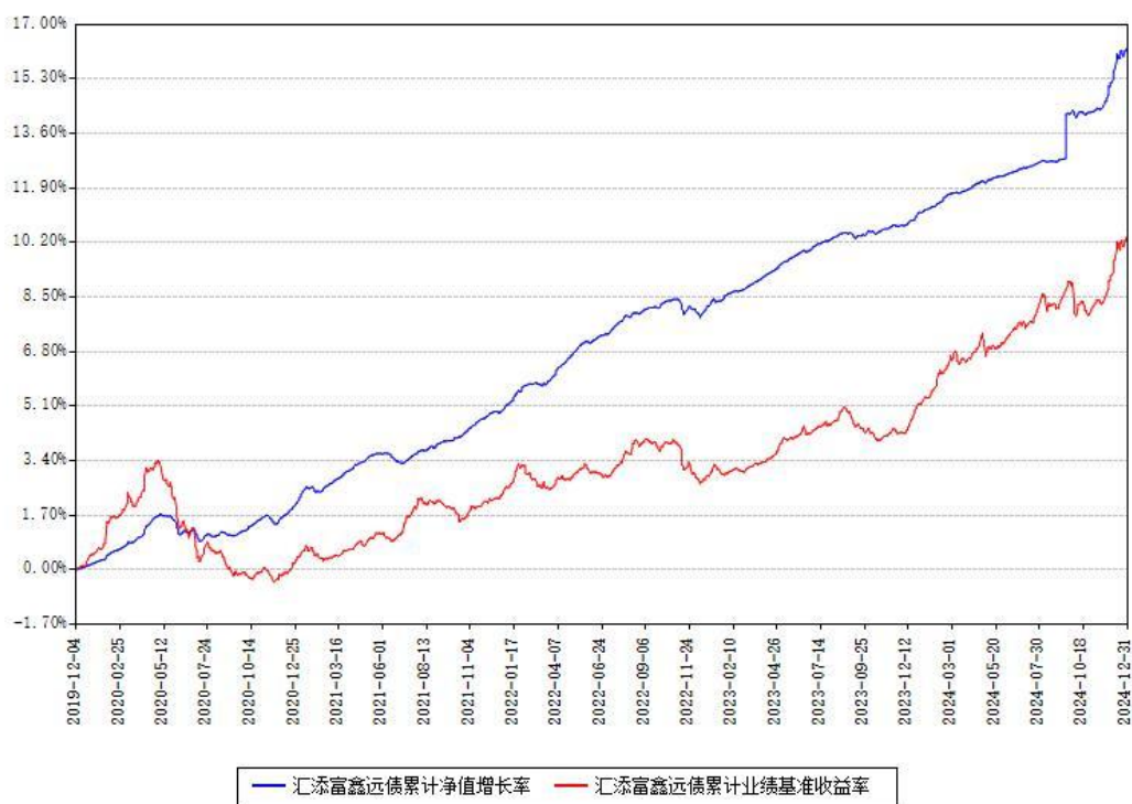
汇添富鑫远债累计净值增长率与同期业绩基准收益率对比图

注：本基金建仓期为本《基金合同》生效之日（2019年12月04日）起6个月，建仓期结束时各项资产配置比例符合合同约定。