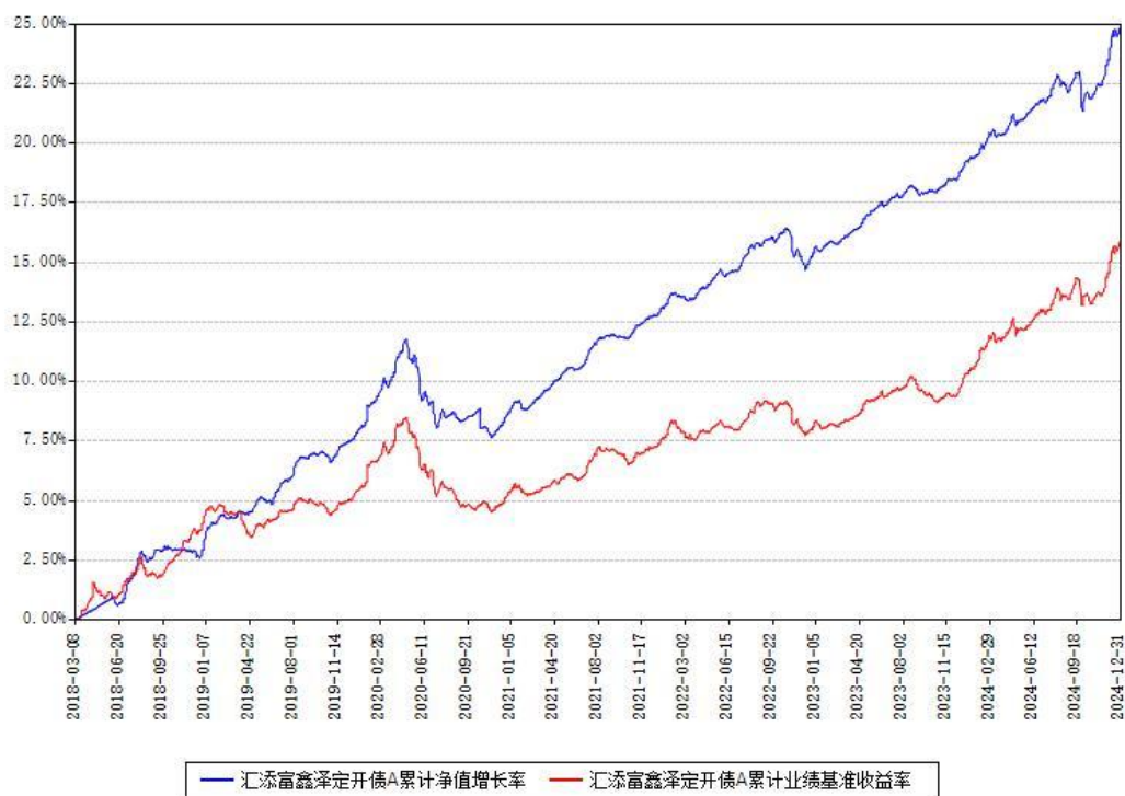
汇添富鑫泽定开债A累计净值增长率与同期业绩基准收益率对比图

注：本基金建仓期为本《基金合同》生效之日（2018年03月08日）起6个月，建仓期结束时各项资产配置比例符合合同约定。