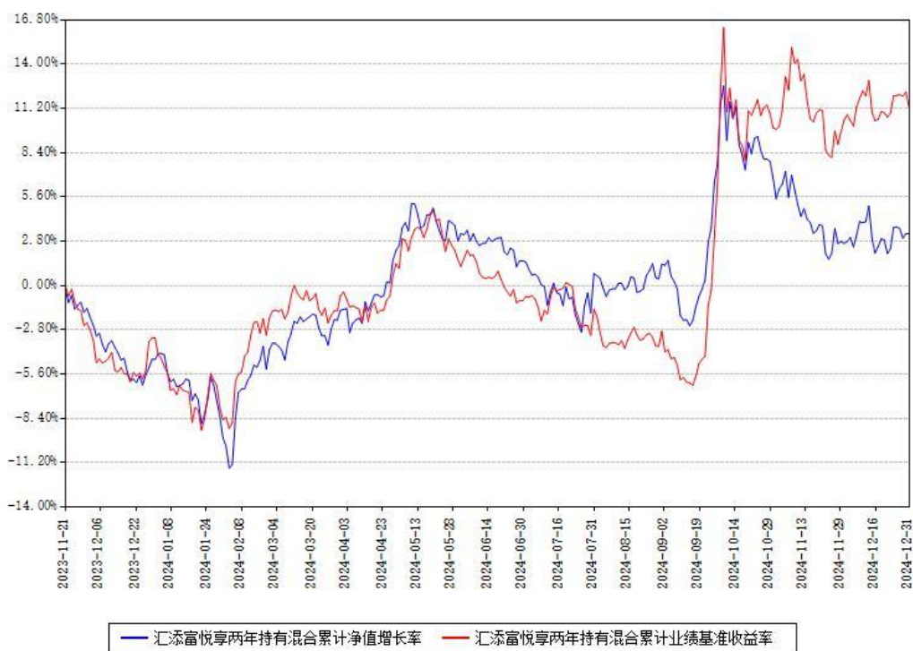
汇添富悦享两年持有混合累计净值增长率与同期业绩基准收益率对比图

注：本基金建仓期为本《基金合同》生效之日（2023年11月21日）起6个月，建仓期结束时各项资产配置比例符合合同约定。