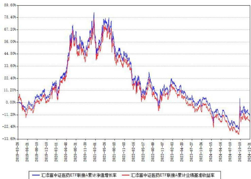
汇添富中证医药ETF联接A累计净值增长率与同期业绩比较基准收益率对比图