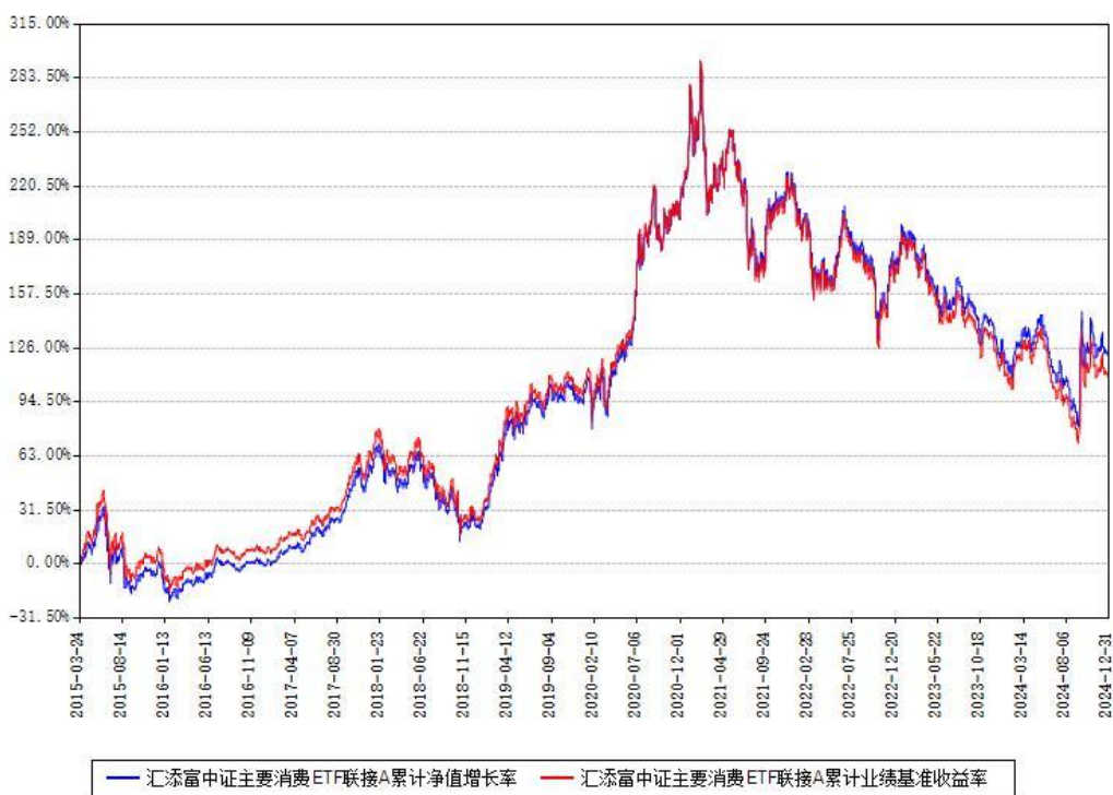
汇添富中证主要消费ETF联接A累计净值增长率与同期业绩比较基准收益率对比图