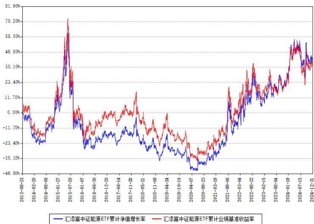
汇添富中证能源ETF累计净值增长率与同期业绩比较基准收益率对比图

注：本基金建仓期为本《基金合同》生效之日（2013年08月23日）起3个月，建仓期结束时各项资产配置比例符合合同约定。