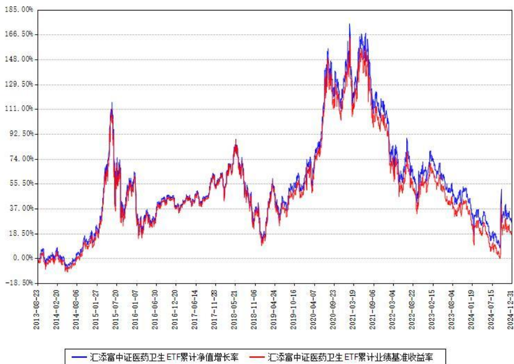
汇添富中证医药卫生ETF累计净值增长率与同期业绩基准收益率对比图

注：本基金建仓期为本《基金合同》生效之日（2013年08月23日）起3个月，建仓期结束时各项资产配置比例符合合同约定。