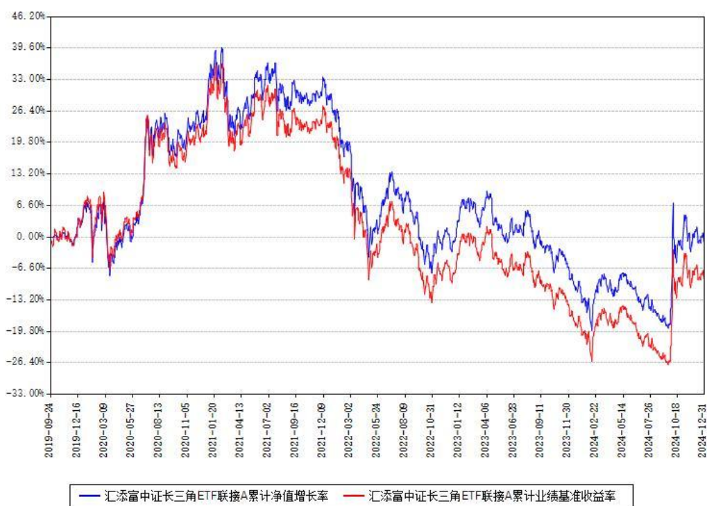
汇添富中证长三角ETF联接A累计净值增长率与同期业绩比较基准收益率对比图