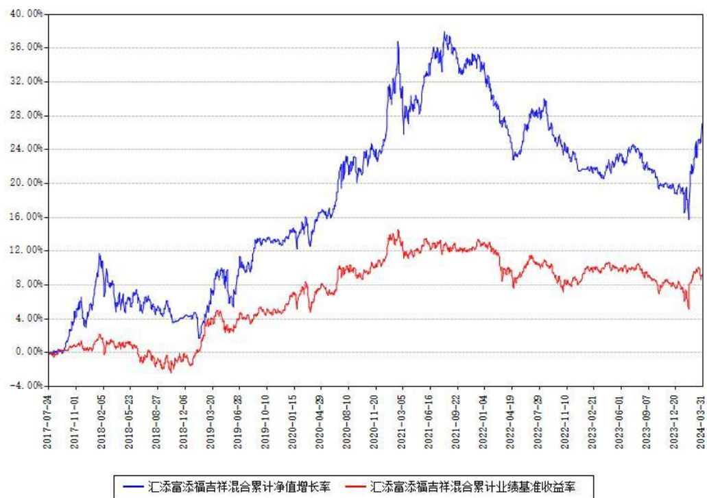
汇添富添福吉祥混合累计净值增长率与同期业绩基准收益率对比图