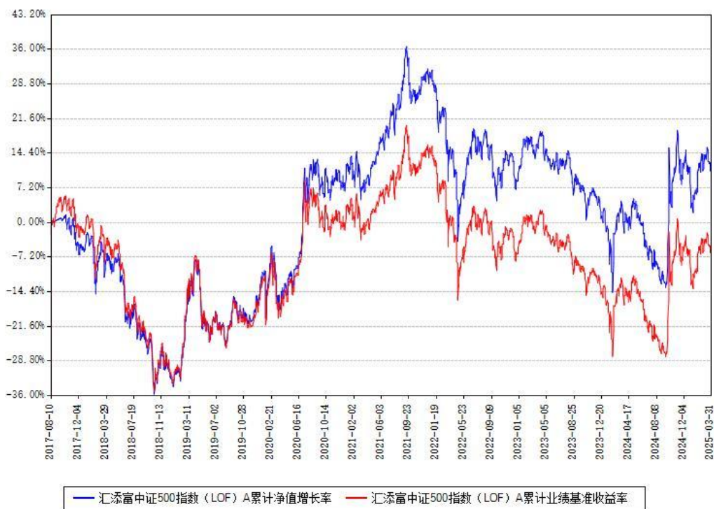
汇添富中证500指数 (LOF) A 累计净值增长率与同期业绩比较基准收益率对比图