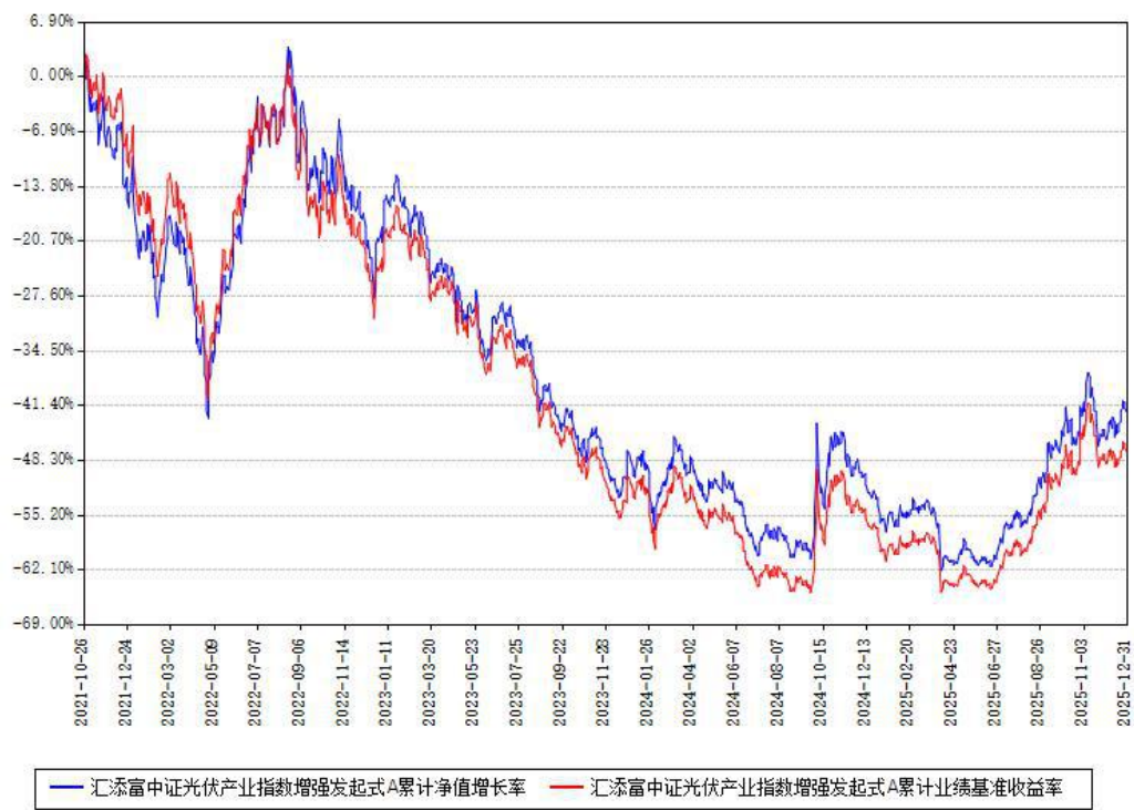
汇添富中证光伏产业指数增强发起式A累计净值增长率与同期业绩基准收益率对比图