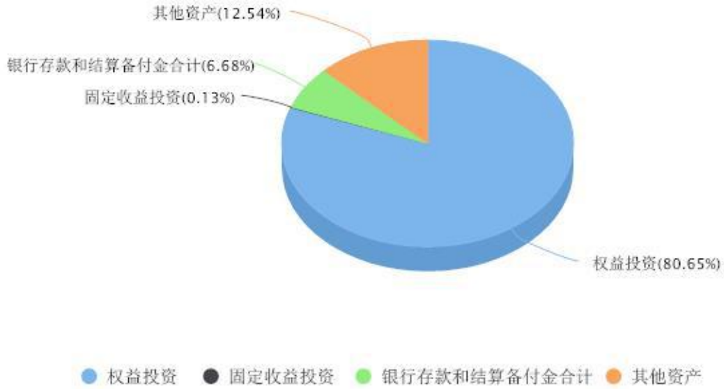
投资组合资产配置图表 数据截止日期:2025年12月31日