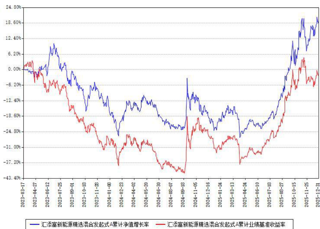
汇添富新能源精选混合发起式A累计净值增长率与同期业绩基准收益率对比图