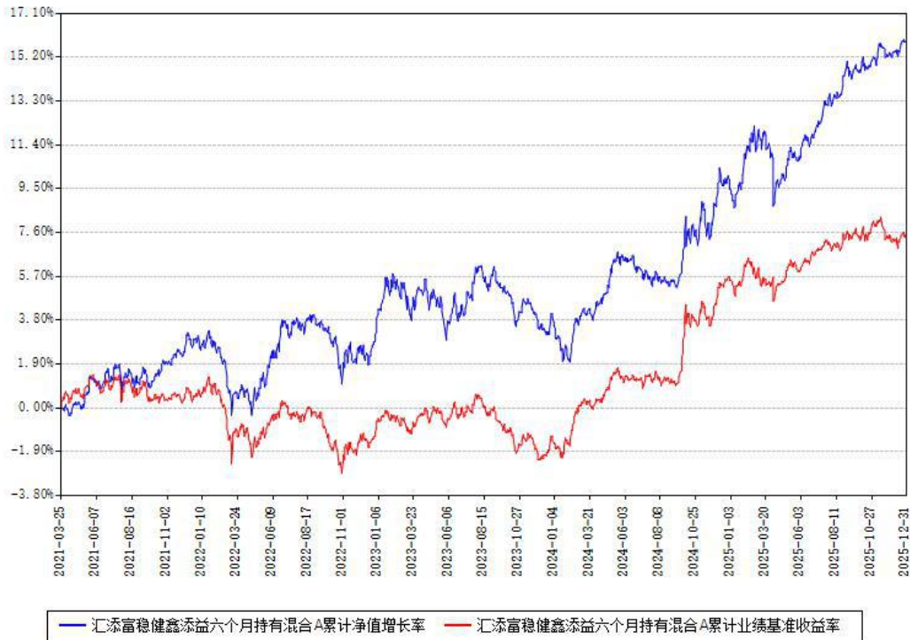
汇添富稳健鑫添益六个月持有混合A累计净值增长率与同期业绩基准收益率对比图