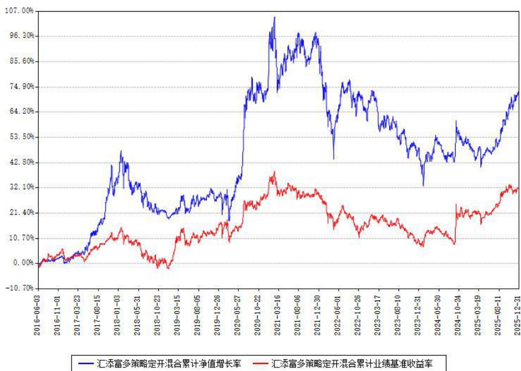
汇添富多策略定开混合累计净值增长率与同期业绩基准收益率对比图

注：本基金建仓期为本《基金合同》生效之日（2016年06月03日）起6个月，建仓期结束时各项资产配置比例符合合同约定。