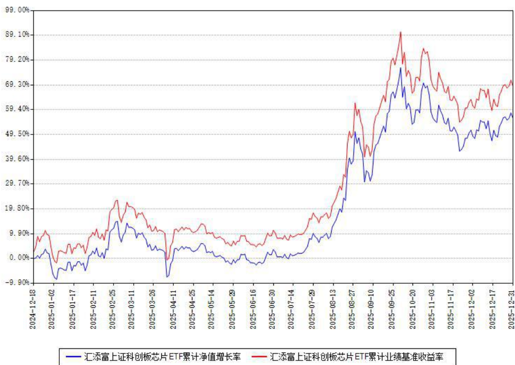
汇添富上证科创板芯片ETF累计净值增长率与同期业绩比较基准收益率对比图

注：本基金建仓期为本《基金合同》生效之日（2024 年 12 月 18 日）起 6 个月，建仓期结束时各项资产配置比例符合合同约定。