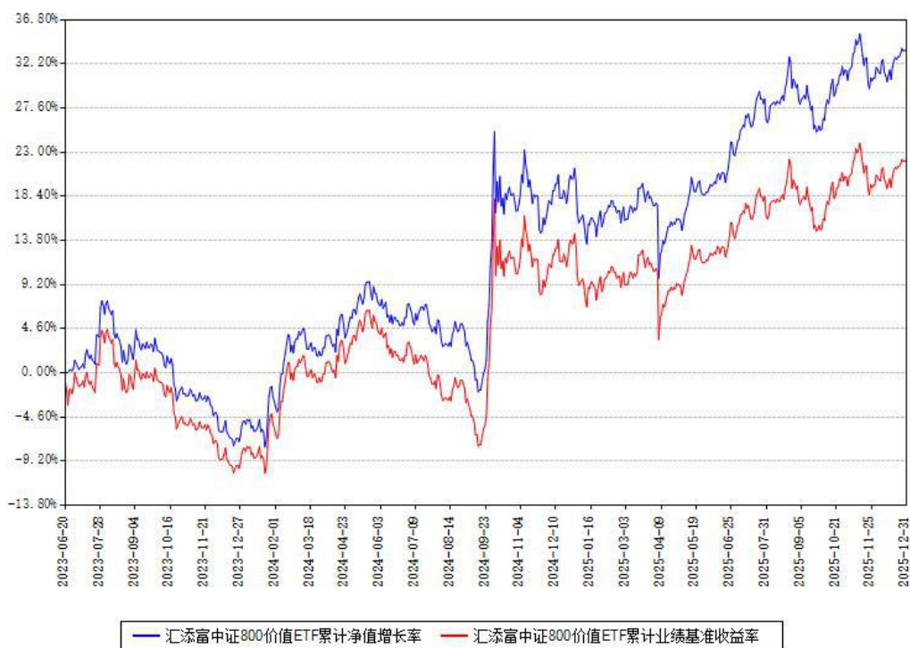
汇添富中证800价值ETF累计净值增长率与同期业绩基准收益率对比图

注：本基金建仓期为本《基金合同》生效之日（2023年06月20日）起6个月，建仓期结束时各项资产配置比例符合合同约定。