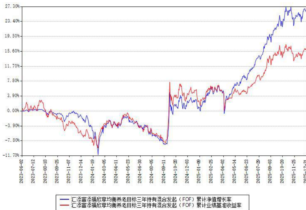
汇添富添福欣享均衡养老目标三年持有混合发起（FOF）累计净值增长率与同期业绩基准收益率对比图

注：本基金建仓期为本《基金合同》生效之日（2023年06月02日）起6个月，建仓期结束时各项资产配置比例符合合同约定。