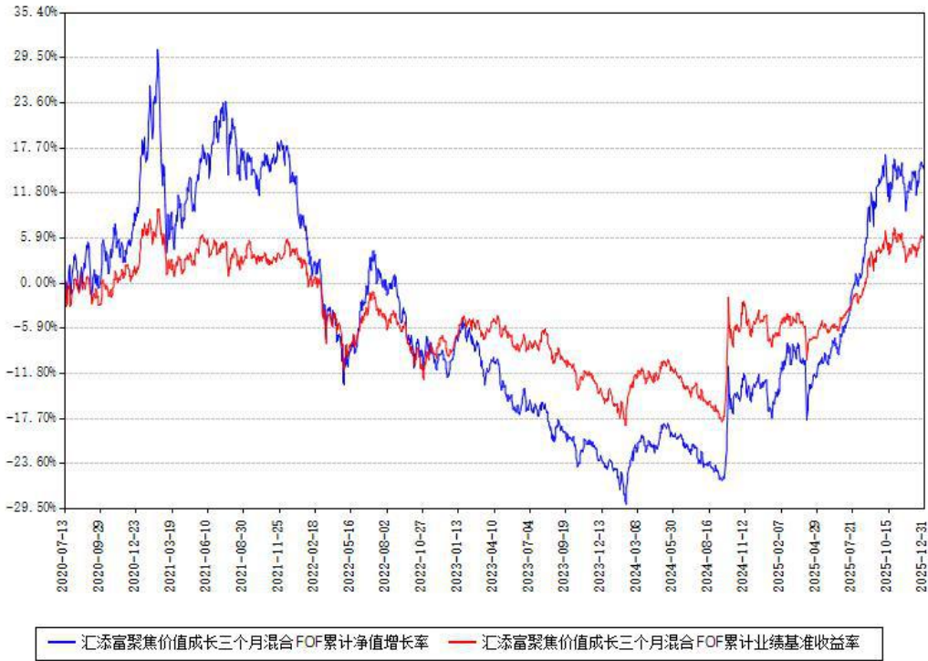
汇添富聚焦价值成长三个月混合FOF累计净值增长率与同期业绩基准收益率对比图

注：本基金建仓期为本《基金合同》生效之日（2020年07月13日）起6个月，建仓期结束时各项资产配置比例符合合同约定。