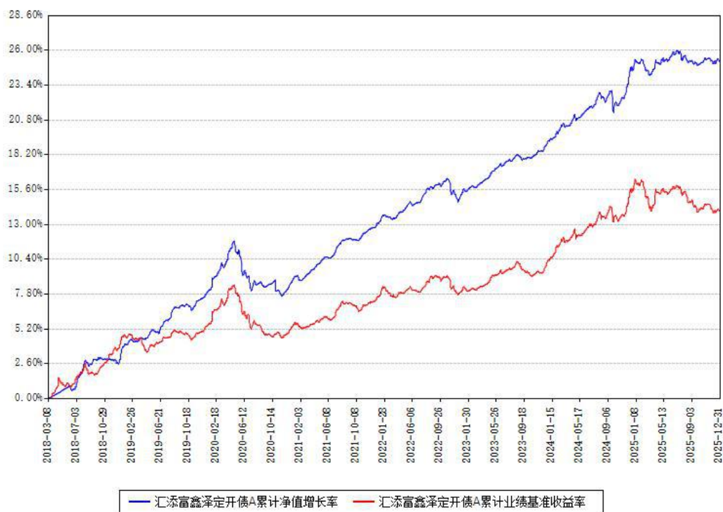
汇添富鑫泽定开债A累计净值增长率与同期业绩基准收益率对比图

注：本基金建仓期为本《基金合同》生效之日（2018年03月08日）起6个月，建仓期结束时各项资产配置比例符合合同约定。