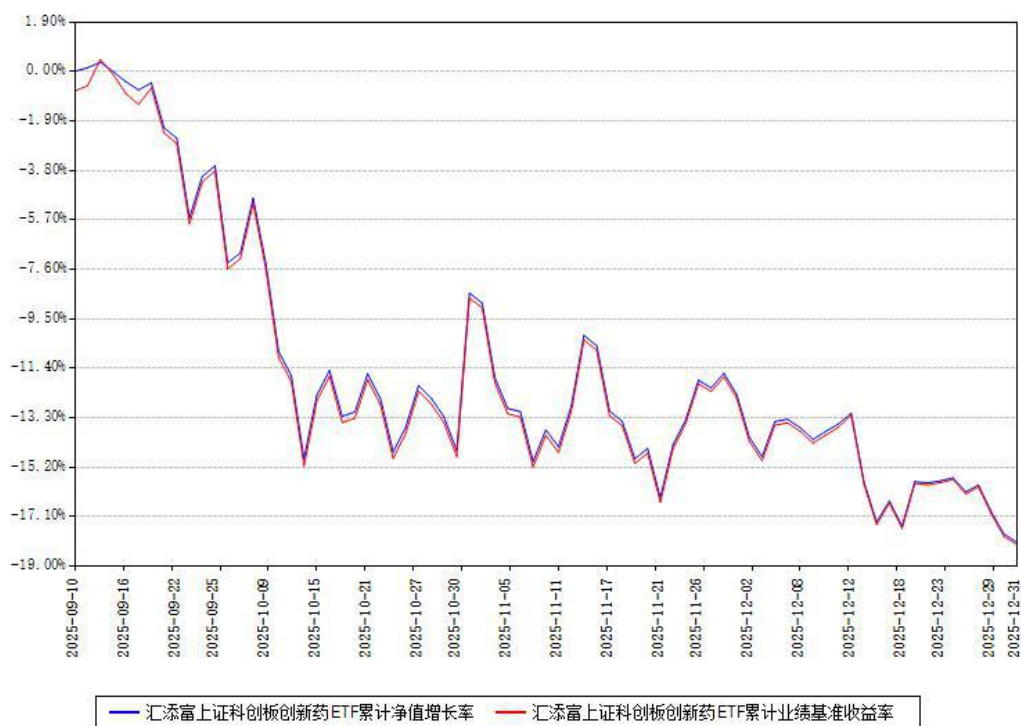
汇添富上证科创板创新药ETF累计净值增长率与同期业绩基准收益率对比图

注：本《基金合同》生效之日为2025年09月10日，截至本报告期末，基金成立未满一年。本基金建仓期为本《基金合同》生效之日起6个月，截至本报告期末，本基金尚处于建仓期中。