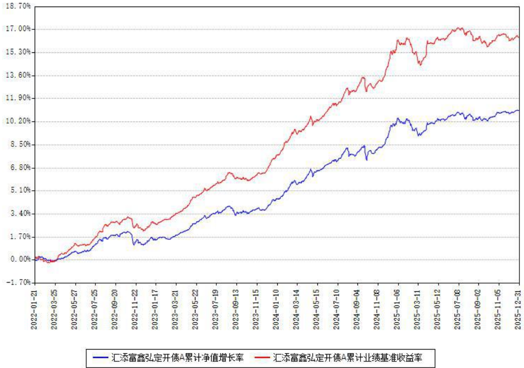
汇添富鑫弘定开债A累计净值增长率与同期业绩基准收益率对比图

注：本基金建仓期为本《基金合同》生效之日（2022年01月21日）起6个月，建仓期结束时各项资产配置比例符合合同约定。