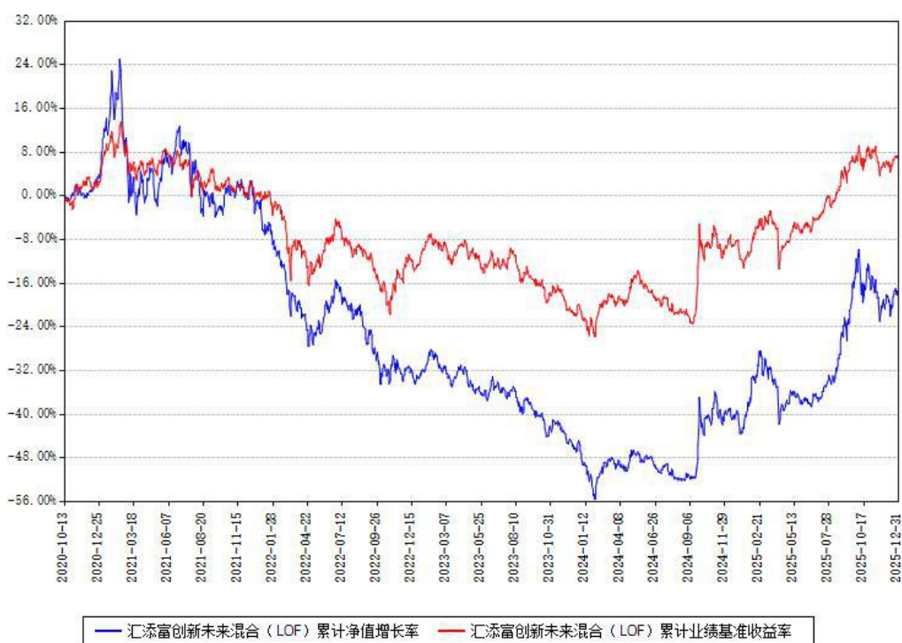
汇添富创新未来混合（LOF）累计净值增长率与同期业绩比较基准收益率对比图

注：本基金建仓期为本《基金合同》生效之日（2020年10月13日）起6个月，建仓期结束时各项资产配置比例符合合同约定。