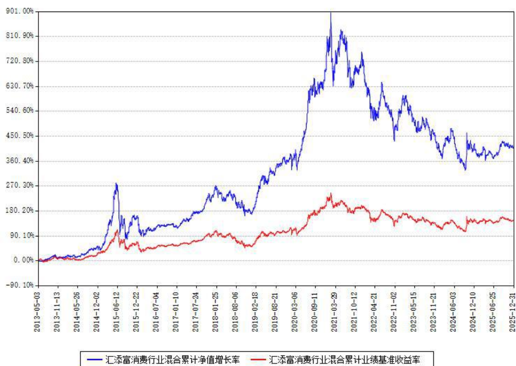
汇添富消费行业混合累计净值增长率与同期业绩基准收益率对比图

注：本基金建仓期为本《基金合同》生效之日（2013年05月03日）起6个月，建仓期结束时各项资产配置比例符合合同约定。